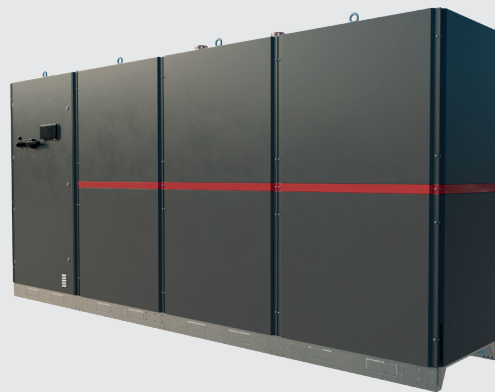
Eco Design vaatimukset täyttävä energiatehokas kylmävesiasema

Uuden sukupolven sisäasenteinen R32 kylmävesiasema Luotettava turvakonsepti Energiatehokas neliportainen tehonsäätö